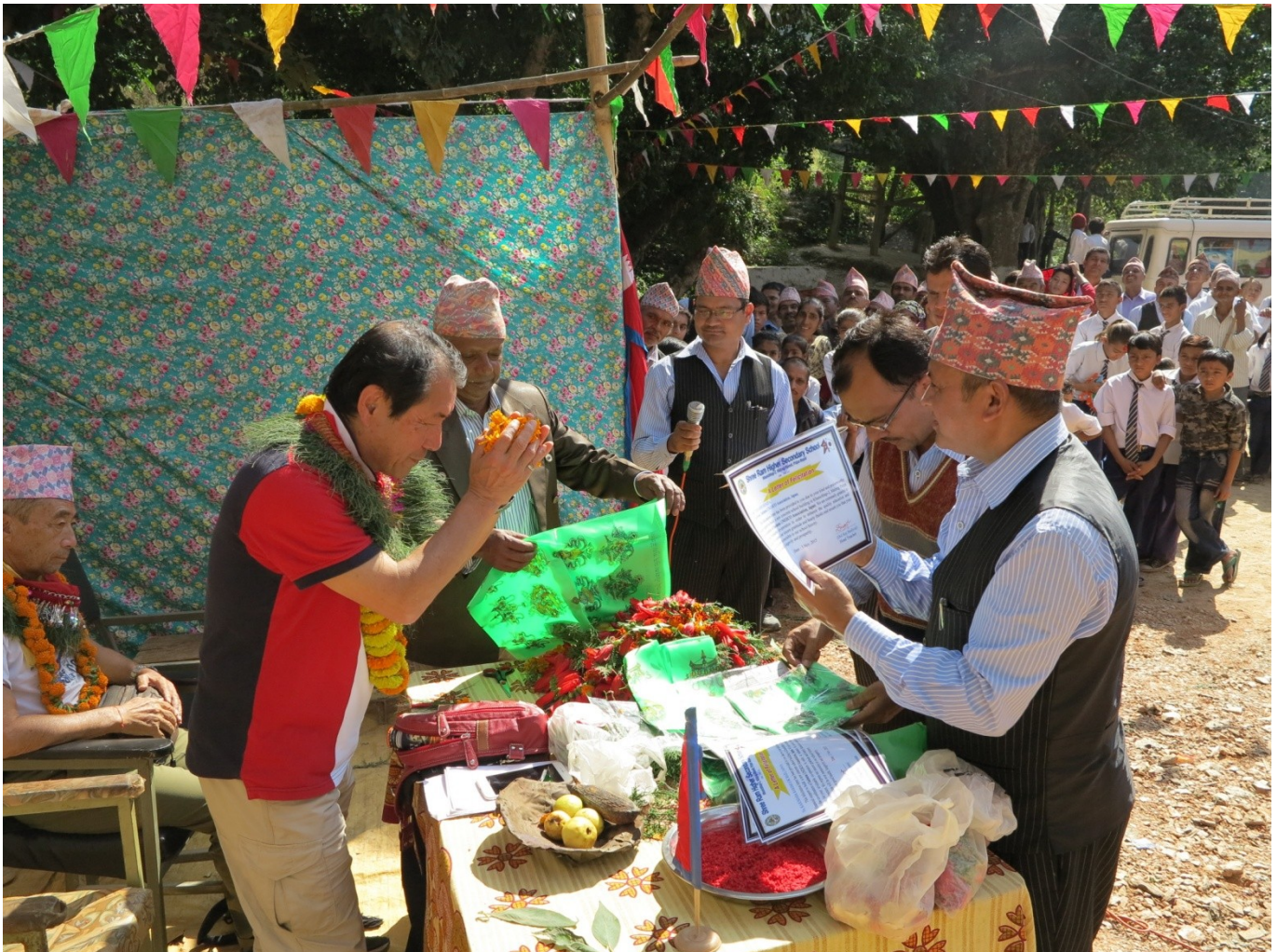
学校から感謝状が贈呈される。