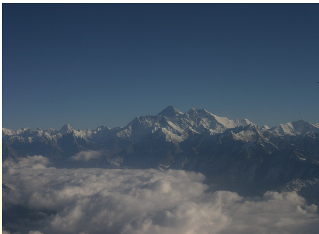
エベレスト (中央の三角ピーク)