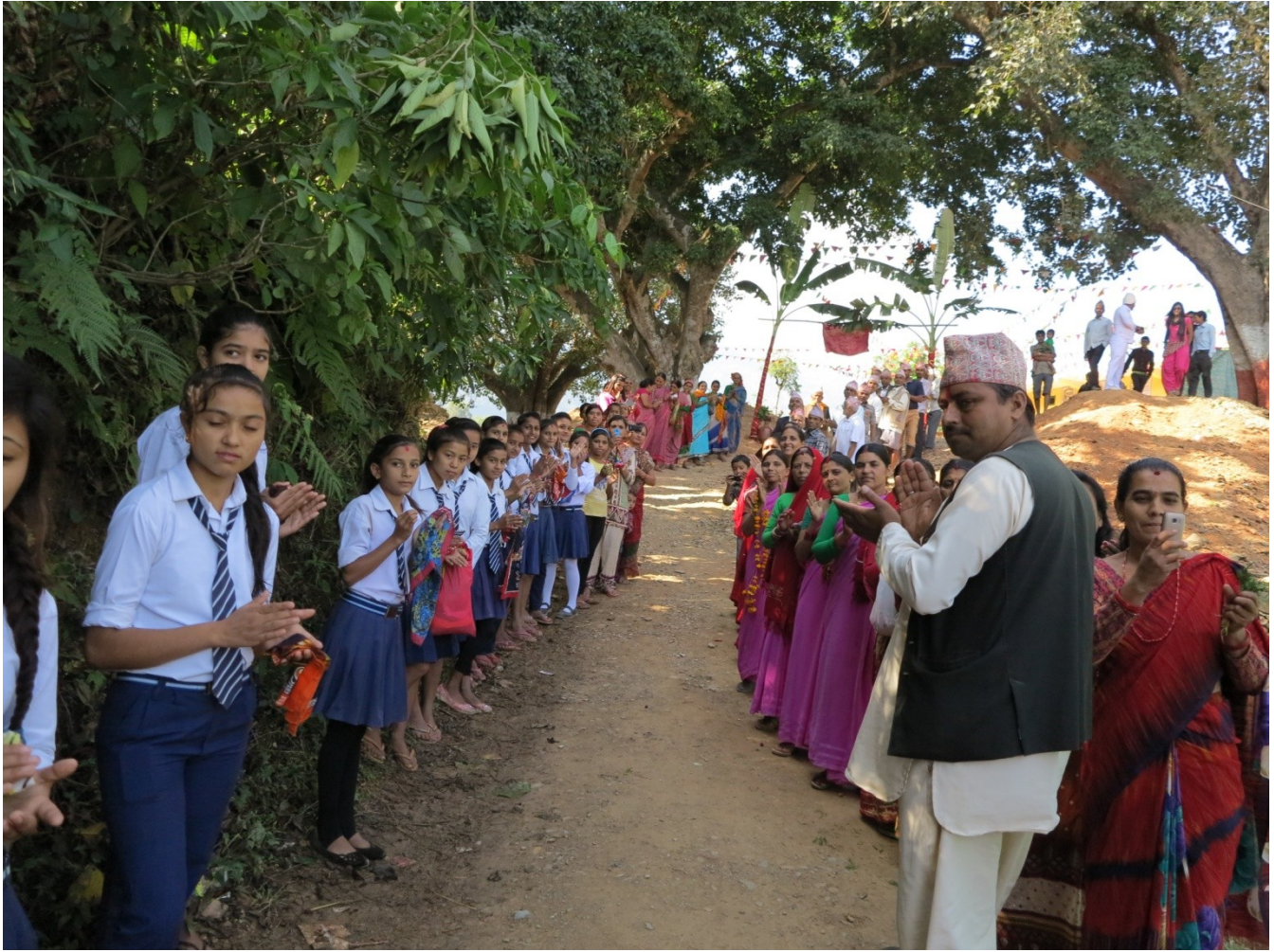
教師・生徒、村人達が到着を待ちわびていた。