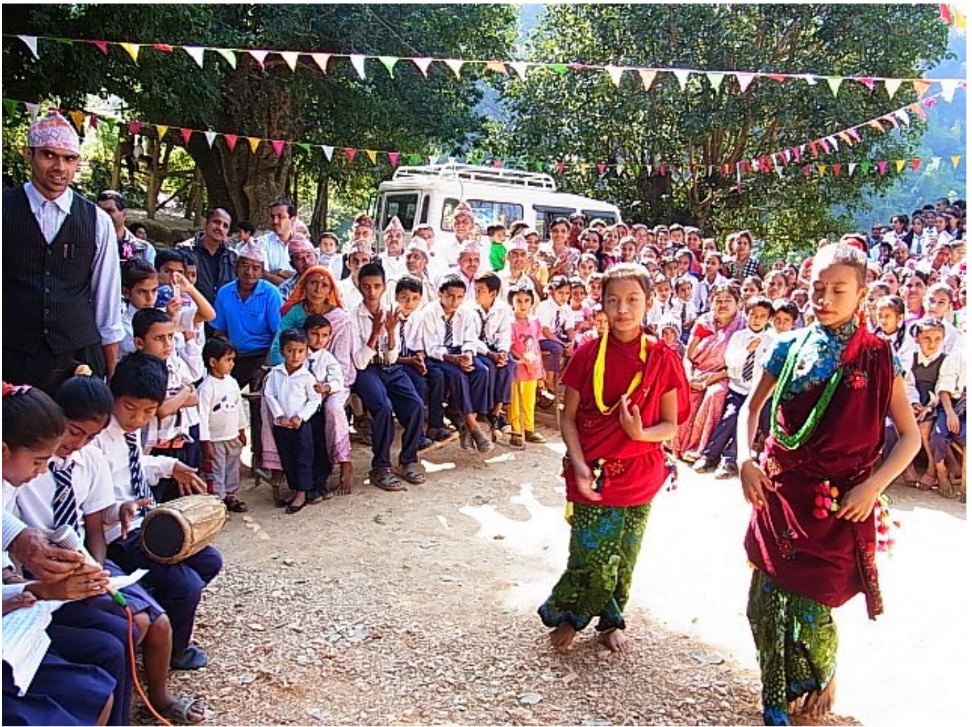
式典で、お祝いの踊りと歌を披露する生徒たち。村中の人々が集まり、新校舎完成を祝う。