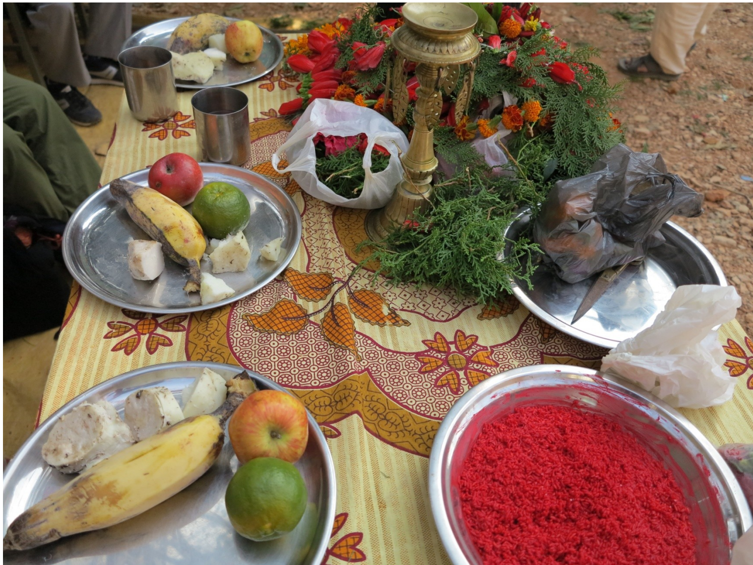
式典でふるまわれた果物。リンゴ以外は全て村で採れたもの。