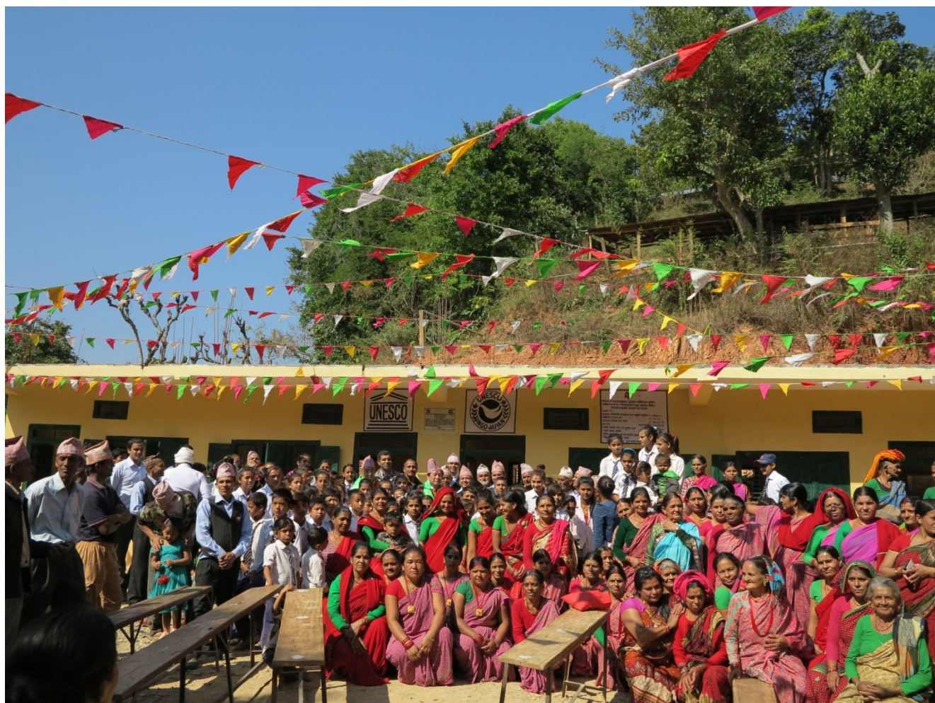
新教室前で、教職員や生徒達と。