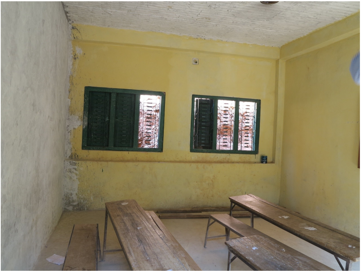
先生と生徒の距離が近い教室。 緊張感と集中力が高まり、最適な学習環境の教室に仕上がった。