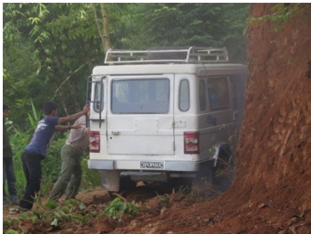
時にはジープを押しながら進む。