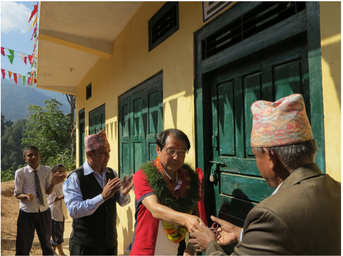
テープカット。そして、新校舎内を視察。ファンも設置され、涼しい環境で学習できる教室。